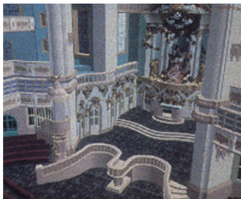
Εικ. 4: Αρχιτεκτονική προσομοίωση εκκλησίας στη Δρέσδη η οποία καταστράφηκε κατά τη διάρκεια του 2ου Παγκοσμίου Πολέμου, με σκοπό την υποστήριξη της ανακατασκευής της

Το πρώτο σύστημα τέτοιας 'αρχιτεκτονικής διαδρομής' (architectural walkthrough) κατασκευάστηκε στο Πανεπιστήμιο της North Carolina (UNC). Σήμερα υπάρχουν αρκετά τέτοια συστήματα στον κόσμο, τα οποία συνήθως χρησιμοποιούνται σαν εργαλεία για την προώθηση πώλησης κατοικιών, επίπλων κουζίνας ή ολόκληρων προκατασκευασμένων εσωτερικών διαμορφώσεων σπιτιών, προσφέροντας τη δυνατότητα στους μελλοντικούς χρήστες να δοκιμάσουν παραλλαγές, βιώνοντας 'εκ των έσω' το αποτέλεσμα και διαλέγοντας αυτό που βλέπουν να τους ταιριάζει περισσότερο. (πχ. Matsushita Electric Works - Division σύστημα για προσομοίωση εξελιγμένων οικιακών περιβαλλόντων).