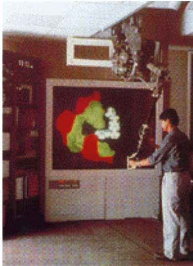
Εικ. 2: Μοριακή μοντελοποίηση στο Πανεπιστήμιο τη North Carolina με το σύστημα ARM.