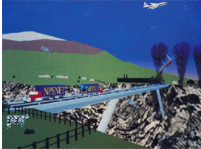
Εικ. 6: Δικτυωμένα συστήματα προσομοίωσης μάχης για περισσότερους από 300 χρήστες - NPSNET research group, Naval Postgraduate School

υπολογιστική ισχύ και δυνατότητες δημιουργίας εικόνων αγγίζουν τα όρια του τι είναι σήμερα εφικτό.