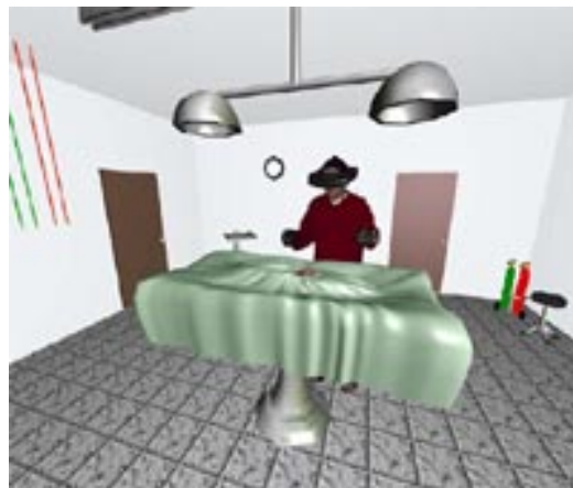
Εικ. 3: Προσομοίωση εγχείρησης σε σύστημα εμβύθισης VR

γ) Θεραπεία: τρισδιάστατα μοντέλα μερών του ανθρωπίνου σώματος χρησιμοποιούνται για τον προγραμματισμό ορθοπεδικών η πλαστικών εγχειρήσεων. Στο Πανεπιστήμιο MIT γίνονται προσπάθειες για την κατασκευή του ψηφιακού μοντέλου ενός ποδιού με βάση την βιο - μηχανική (biomechanical) του συμπεριφορά, με στόχο η προσομοίωση των συνεπειών του προβλήματός του να βοηθά τον προγραμματισμό τυχόν εγχειρήσεων. Στο μέλλον οι προσπάθειες θα στραφούν στη επέκταση του μοντέλου και σε άλλα μέρη του σώματος και στην πιθανή διαδικασία μεταβολής του για την παραγωγή ενός μοντέλου που να αντιστοιχεί στον εκάστοτε ασθενή.