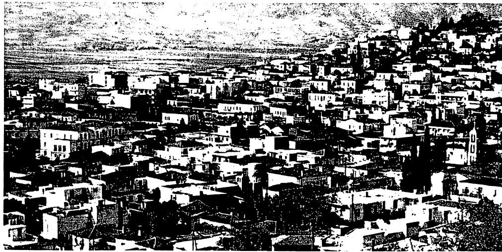
Πανοραμική άποψη τής Λευκάδας, πρωτεύουσας του όμώνυμου νομού.

Από τήν άρχή, ή άρνητική συμβολή του R. Hercher διατήρησε τήν άμφίβολια γιά τήν όμηρική 'Ιθάκη μέχρι τήν έποχή του Σλήμαν και, τέλος, οι έρευνες του Νταϊρπφλεντ δημιούργησαν μία κατάσταση άβέβαιη, έλλείπει και πάλι, έπαρκών ως πρός τόν αριθμό μυκηναϊκών εύρημάτων. Πάντως, τά μέχρι τώρα εύρήματα πού σημειώθηκαν στή Λευκάδα [Χοιροσπηλιά, 'Αγ. Σωτήρος, Νυδρί, Σπαρτοχώρι (στό γειτονικό Μεγανήσι)], δέν εύνοϋν τήν ταύτιση τής Λευκάδας πρός τήν όμηρική 'Ιθάκη, πράγμα πού απέκρουσε και ή άγγλίδα