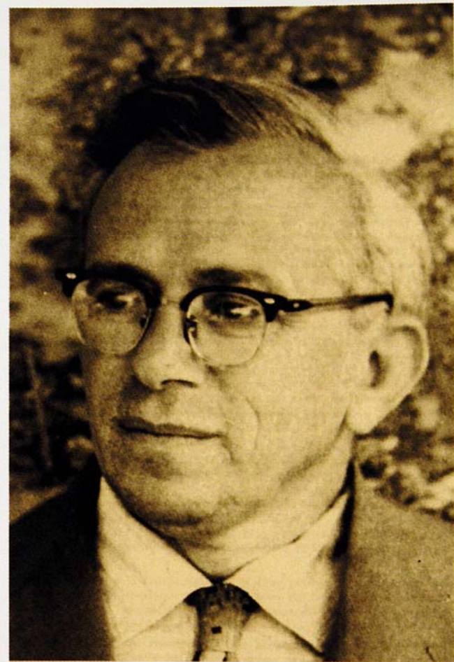
Fig. 7. Nikolaos Platon.