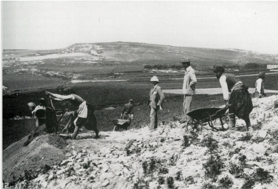
FIG. 16 Evans and Mackenzie at the excavation of the Palace of Minos, watching workmen at the south dump.